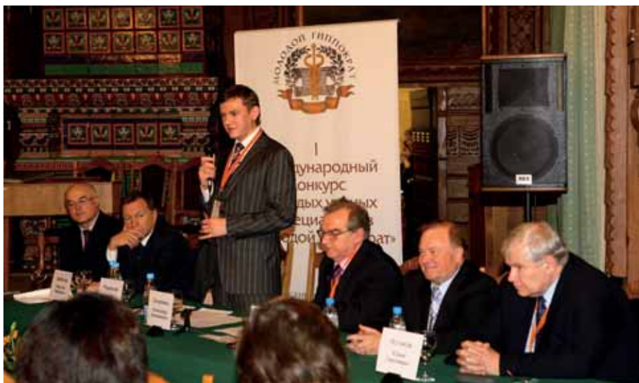
Подведение итогов первого международного конкурса, организованного под эгидой благотворительного фонда "Молодой Гиппократ" и компании "Герофарм"

В 2009-2010 годах продолжится многоплановая работа по расширению научных исследований. Среди перспективных разработок - пептидные препараты, применяемые в офтальмологии, неврологии и других областях. Часть разработок находится на завершающей стадии доклини-