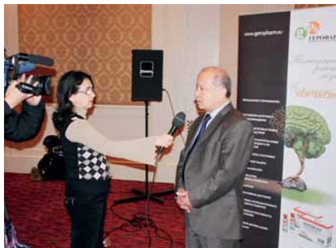
Конференция "Актуальные проблемы неврологии. Успехи нейропротекции - от теории к практике". Узбекистан, 2008.