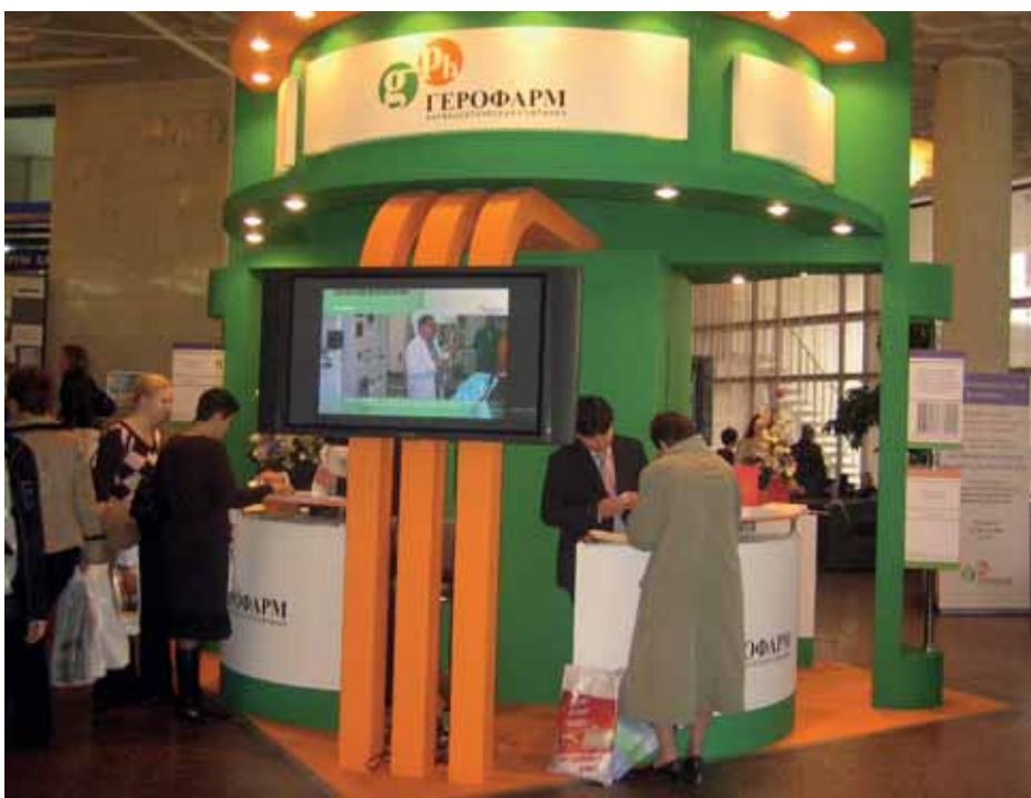
Стенд "Герофарм" на Национальном конгрессе "Человек и лекарство" 2008