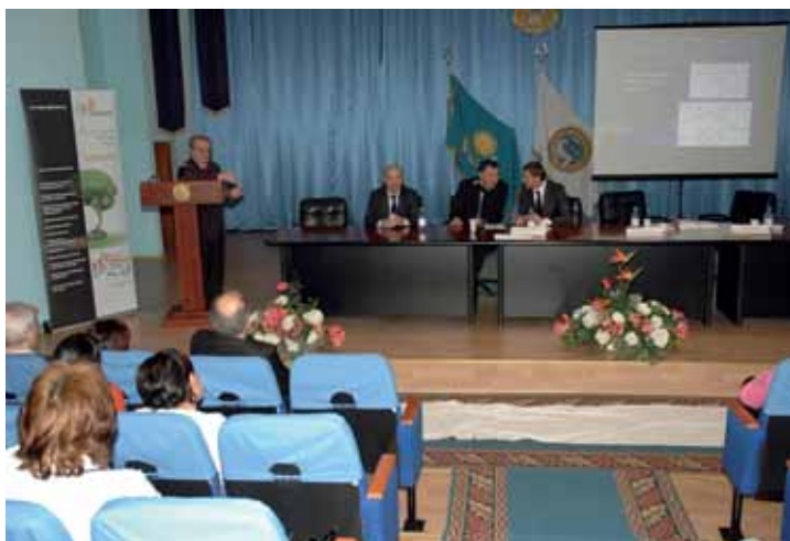
Научно-практическая конференция по неврологии. Казахстан, 2008.

Эффективная организационная и финансовая структура позволила компании интенсивно развиваться в рамках производства инновационных лекарственных средств в условиях острой конкуренции с зарубежными производителями. Компания нацелена на дальнейшее освоение перспективных секторов фармацевтического рынка. Успех и постоянное развитие "Герофарм" - результат работы слаженной команды специалистов.